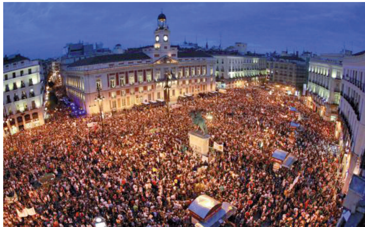
Puerta del Sol, piazza principale della città

La prima differenza che si nota tra noi e gli spagnoli è la loro abitudine, perfino nelle metropoli come Madrid, di vivere fuori da casa, all'aperto. Per questo gli spazi pubblici come i parchi o le zone della città chiuse al traffico sono numerose e mantenute in perfetto ordine e pulizia.